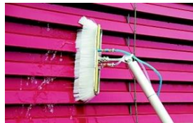
Lamellenbürste für die Storenreinigung