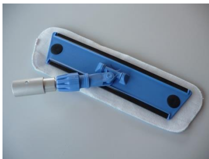
Feuchtwischmop (in Gebrauch) mit Übergang Carbon od. Alu