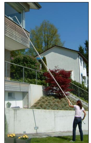
ohne Unfallgefahr !