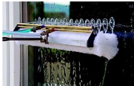
Waschkopf mit Pad reinigt bis in die Rahmenkanten

STRATO steht seit über 30 Jahren für Beständigkeit und Stabilität, verbunden mit Schweizer Qualität und Freude am Produkt. Individuelle Kundenberatung ist uns sehr wichtig. Auf Wunsch wird jedes Gerät am Objekt vorgeführt und angepasst.