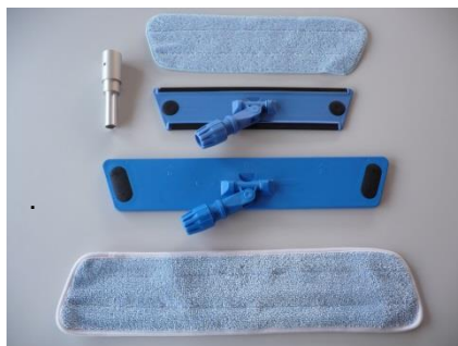
Feuchtwischmop und Tücher