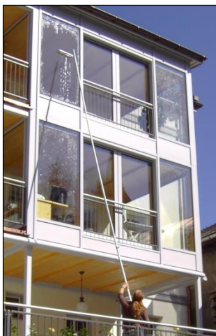
Ob Glas- und Rahmen...