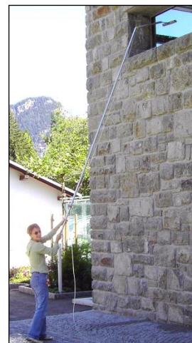
handlich und leicht...